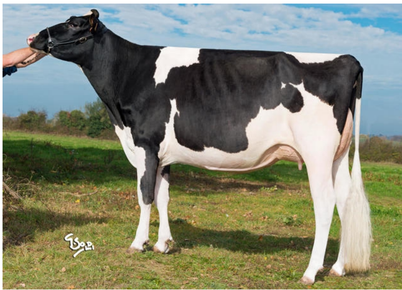
LACAPITALE, madre de NEWSTAR